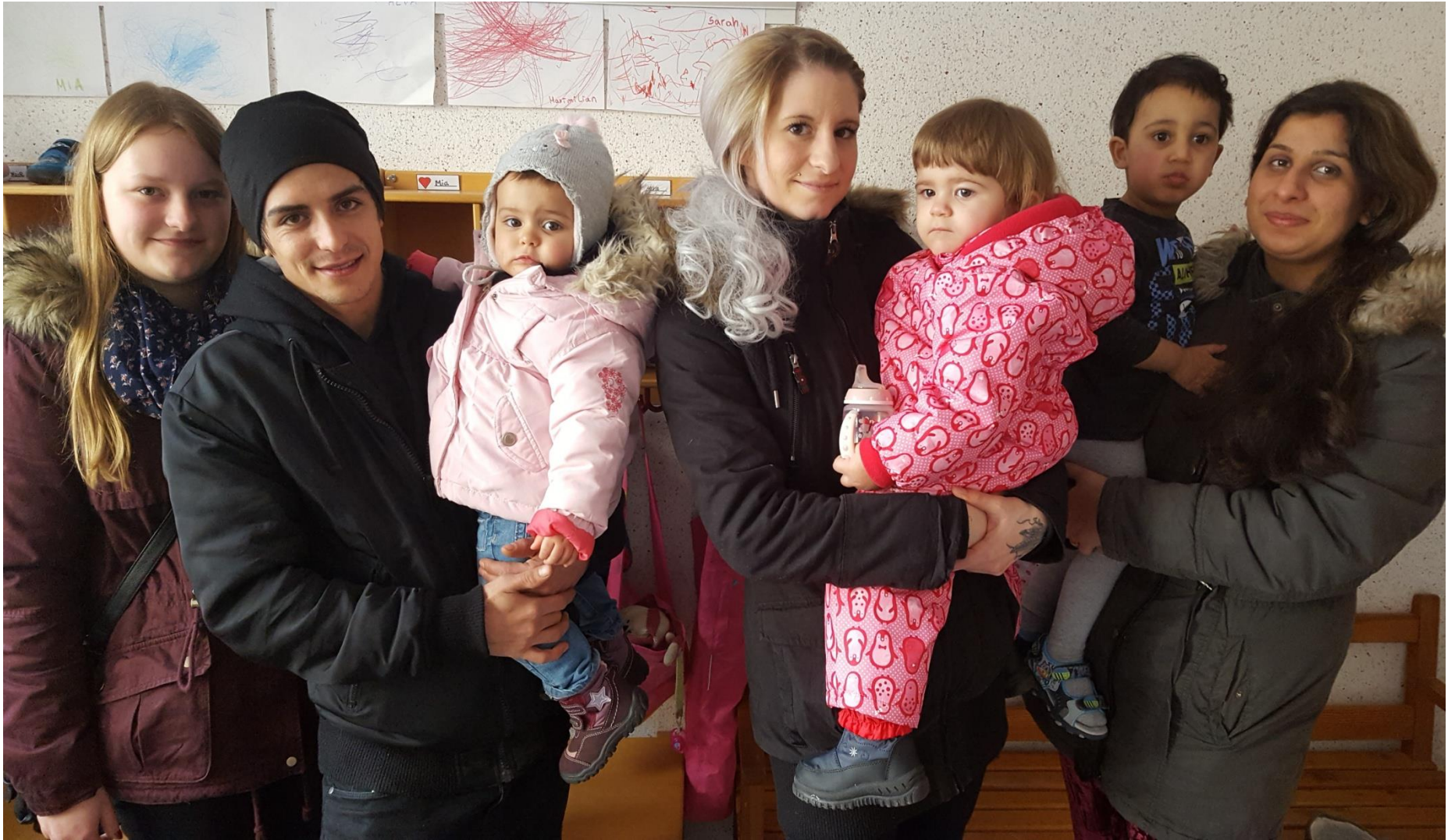
Kita Kinderland 02/ 2018