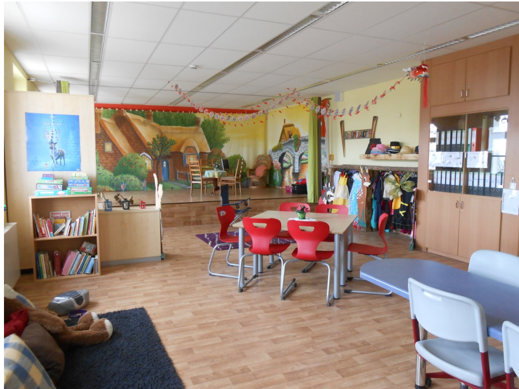
Sprach / Theaterraum