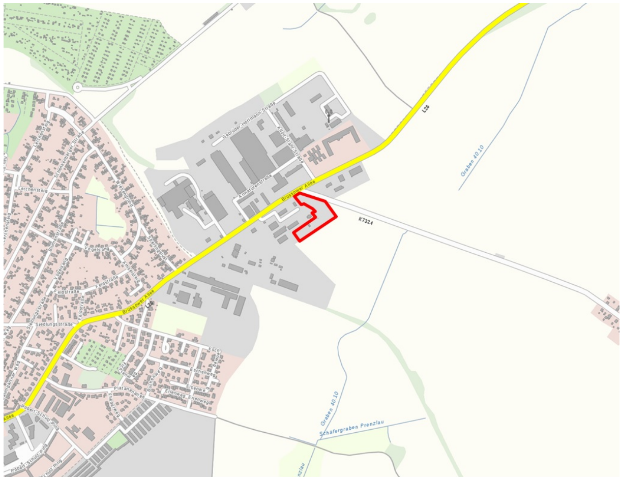
Abb. 1: Lage Plangebiet