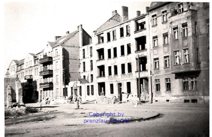
Winterfeldtstraße 1945, Ruine der Eckbebauung Am Durchbruch