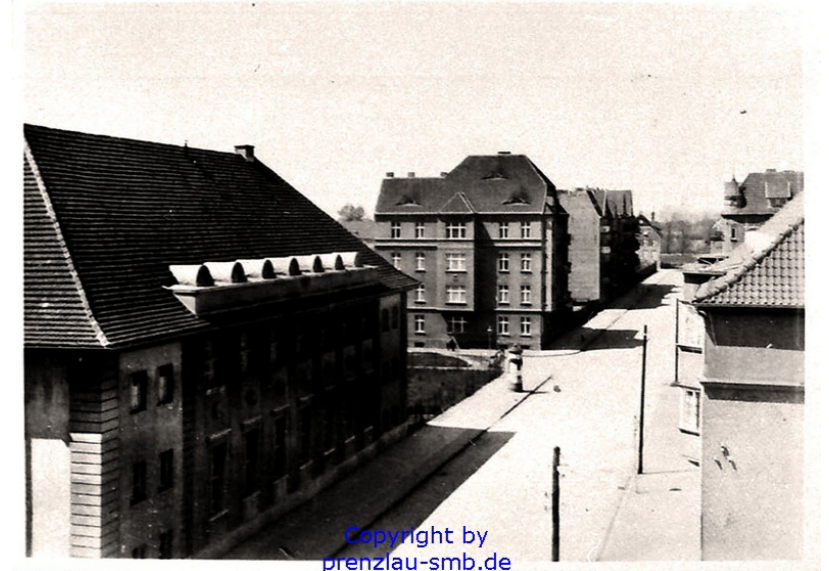
Winterfeldtstraße 1930, Turnhalle Pestalozzischule, Blick auf das Vorhabengrundstück mit Eckbebauung Am Durchbruch

2) EINZELHANDEL Grundstücksgröße: = 5.111 m 2 GRZ (I) = 2.144 m 2 / 5.111 m 2 = 0,4 GRZ (II) = (2.144+2.120) / 5.111 = 0,8