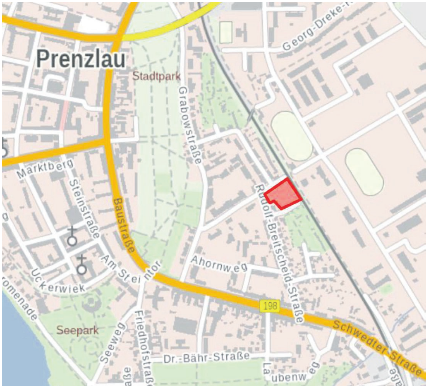
Lage des Plangebietes