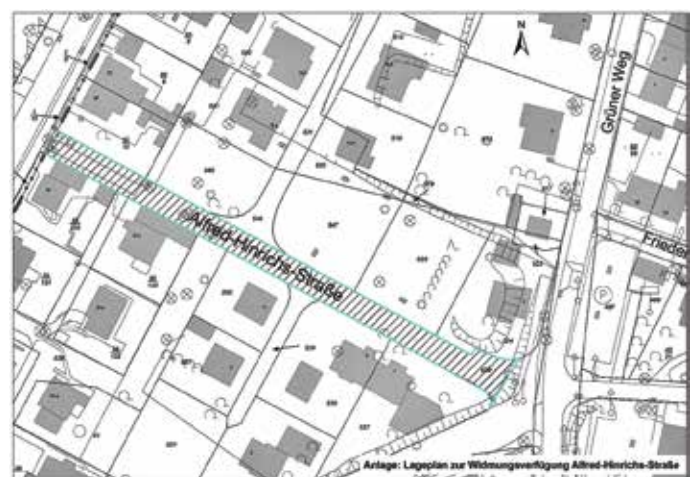
Anlage: Lageplan zur Widmungsverfügung Alfred-Hinrichs-Straße

Er ist innerhalb eines Monats nach Bekanntgabe schriftlich oder zur Niederschrift bei der Stadt Prenzlau, Am Steintor 4, 17291 Prenzlau zu erheben.